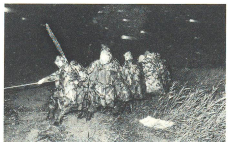
Nach dem Sprung aufs Festland hielten die Rekruten die Fähre mit vereinten Kräften fest, bis sie gesichert werden konnte.