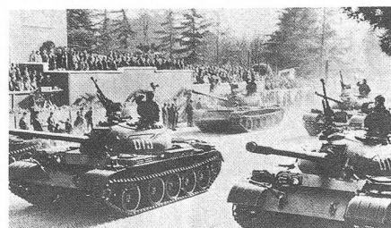
Panzer der Volksbefreiungsarmee defilieren vor der Parteiführung in Tirana am 28. November 1979.