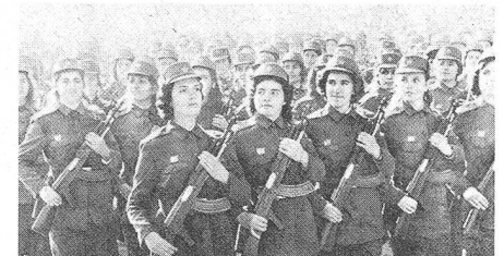
Paramilitärische Formationen an der Parade (Das Bild zeigt Studentinnen der Universität Tirana in Uniform)