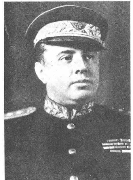
Parteichef und oberster Kriegsherr der Volksbefreiungsarmee Enver Hoxha in Generalsuniform

Dazu zählt man noch die paramilitärischen Formationen mit 13 000 Mann, die inneren Sicherheitskräfte mit 5000 Mann und Grenztruppen in der Höhe von 8000 Mann.