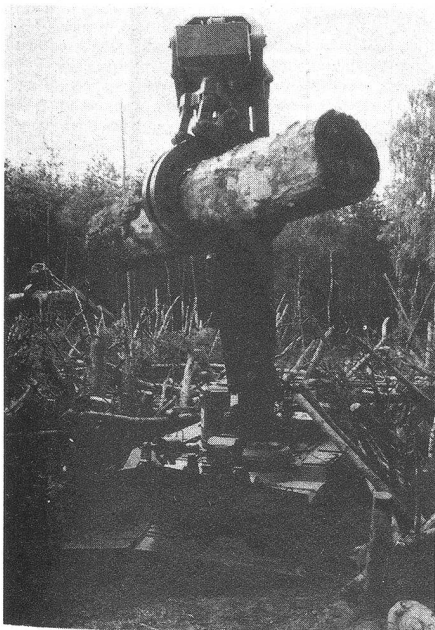
Spezialpanzer auf der Basis des Panzers T-55 mit Ausleger zum Räumen von Hindernissen. A T