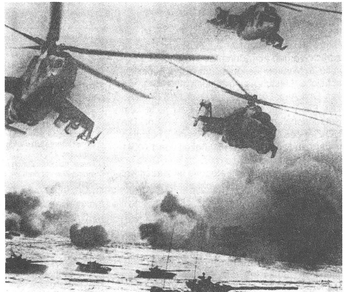
Die Sowjetunion hat erkannt, dass die konsequente Ausnutzung der dritten Dimension, in Kombination mit der Panzerwaffe, in Zukunft der erfolgsversprechendste Weg einer modernen Armee ist.

Stets werden die Vorzüge der Luftbeweglichkeit in Verbindung mit den Besonderheiten eines Nuklearkrieges gesehen, denn nach sowjetischer Auffassung bleibt bei einem neuen Weltkrieg die Nuklearwaffe die kriegs-