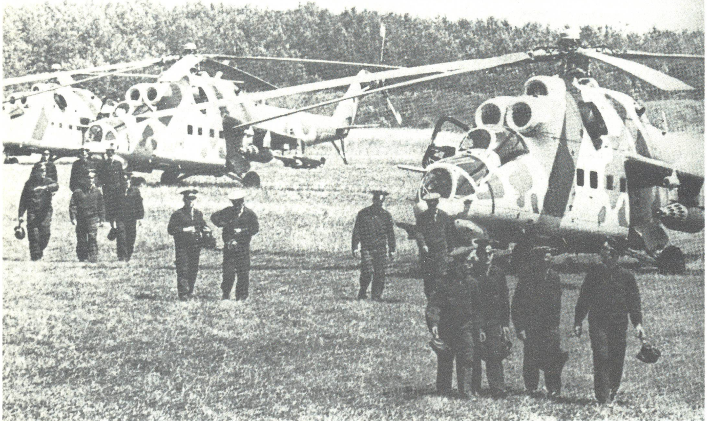
Der Ausbildung der Kampfhelikopter-Besatzungen wird grosse Bedeutung beigemessen. Zusätzlich zur fliegertaktischen Ausbildung erhalten sie eine Ausbildung in der Taktik der Erdtruppen, um eine wirkungsvolle Luftnahunterstützung zu gewährleisten. Mi-24-HIND-Kampfhubschrauber während den Manövern Karpatay (77). Beachte die Raketenpods für je 32 S-5-57 mm ungelenkte Flugkörper und die 2 PAL beim mittleren HIND.

Die Bewaffnung der sowjetischen Hubschrauber mit Panzerabwehrwaffen PAL erlaubt deren Einsatz zur Panzerbekämpfung im selbständigen Einsatz (mobile Einsatzreserve), als auch im Kampf der verbundenen Waffen. Hierzu werden die Kampfhelikopterbesatzungen, gleich wie in westlichen Armeen, theoretisch und in praktischen Übungen in der Erdkampf-Taktik geschult. Das sowjetische Hubschrauberangriffsverfahren ist dem amerikanischen in den Grundzügen ähnlich, wobei die praktische Ausführung mit dem Mi-24 allerdings weniger raffiniert