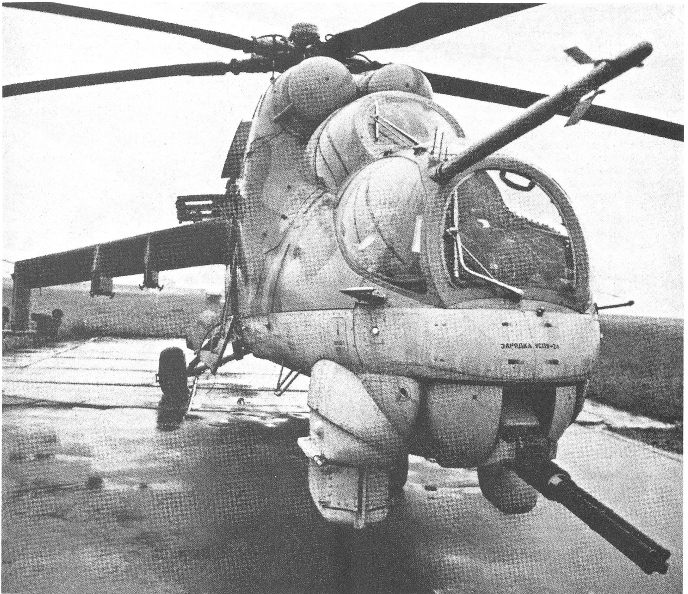
Mi-24 HIND. Mit dem folgenden Bild zusammen die wohl bis jetzt besten veröffentlichten Fotos (aus der tschechischen Revue Letectvi & Kosmonautica). Gut sichtbar sind Rumpfkanoone, Stummelflügel mit Aufhängevorrichtung für 2 Raketenpods (innen) und 2 Panzerabwehrlenk Waffen (ausssen). Pilot und Schütze sitzen hintereinander.