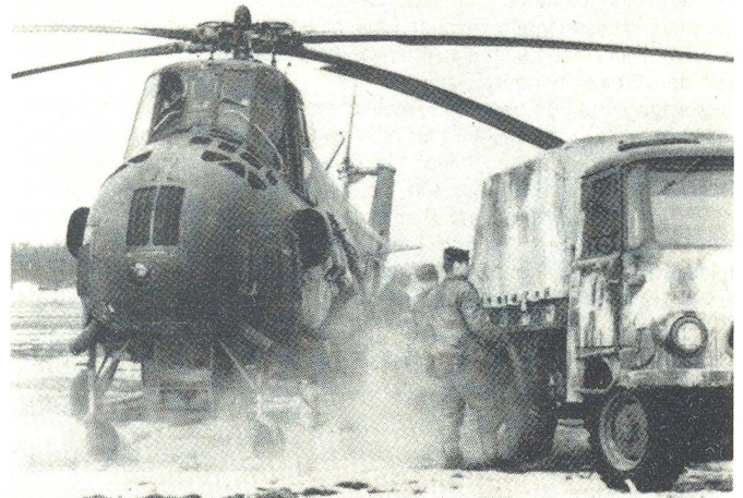
Die kontinuierlich angestrebte Steigerung der Angriffsgeschwindigkeit wird für die Versorgung von Helikoptern besondere Probleme mit sich bringen. Mi-4 (HOUND) auf einem Feldstützpunkt.