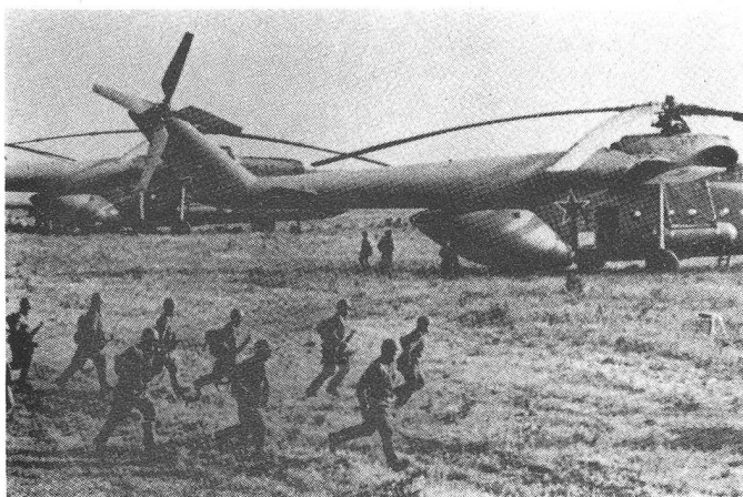
Der Mi-6 (HOOK) fasst bis zu 65 ausgerüstete Soldaten oder kann Materialtransporte bis zu einer Nutzmasse von 12000 kg durchführen.