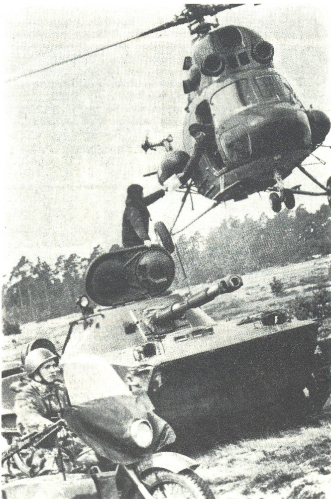
Verbindungshelikopter Mi-2; Übergabe einer Meldung an die Besatzung eines Spähpanzers PT-76.

Wie eingangs erwähnt, sind luftbewegliche Einsätze durch ausserordentlich grosse Flexibilität und die beim Gegner erzielte Überraschung gekennzeichnet. Dies zwingt den Kommandanten, die Resultate des Nachrichtendienstes zeitverzugslos auszuwerten und in minutiöse zeitliche Planung der Aktion und Koordination der Feuerunterstützung umzusetzen, um eine rasche und reibungslose Abwicklung des Angriffs aus der Luft sicherzustellen. Der sich in dauerndem Fluss befindliche Ablauf der einzelnen Aktionen muss vom Kommandanten meist aus der Luft überblickt und koordiniert werden. Um den Erfolg sicherzustellen, muss auf allen Stufen mit einer grossen Handlungsfreiheit initiativ gehandelt