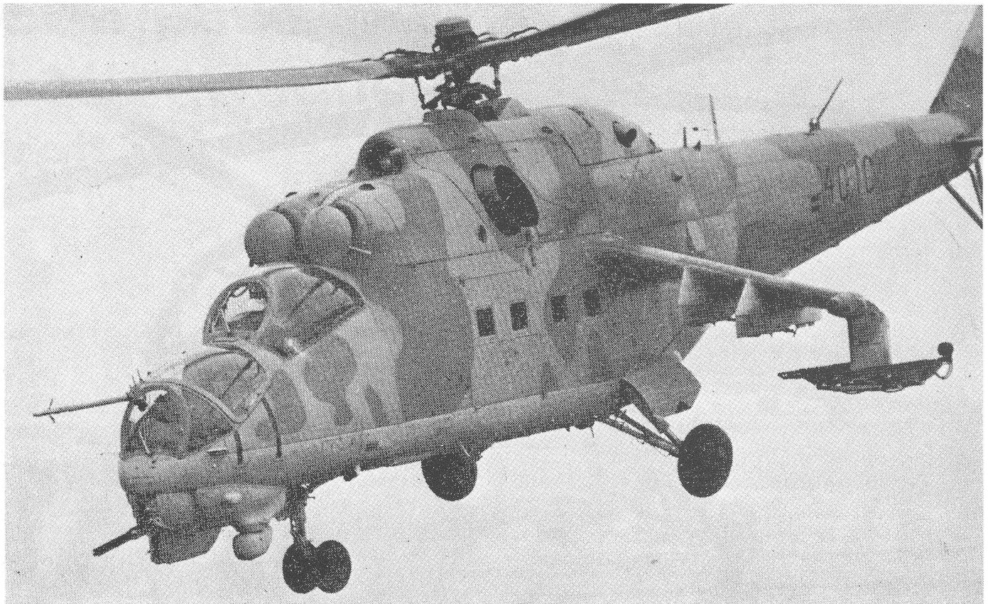
Besonderes Aufsehen hat im Westen die Entwicklung des Mehrzweck-Kampfhubschraubers Mi-24 HIND erregt. Neben einer starken Bewaffnung kann er zusätzlich 8–12 ausgerüstete Soldaten transportieren.