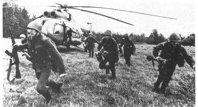
Der Mi-8 (HIP) kann als Standardhubschrauber für taktische Luftlandungen 28 ausgerüstete Soldaten oder 4000 kg Nutzmasse transportieren. Eine Bewaffnung mit Luft-Boden-Raketen und PAL ist möglich.

Nach Ansicht von LtGen Harry W.O. Kinnard (ehemaliger Kdt der 11. Air Assault und 1. Cavalry Division) bestehen jedoch Anzeichen, dass die Sowjetunion von diesem etwas schwerfälligen Einsatzkonzept abweichen könnte. Neben Kampfhelikoptern, Leichten Transporthelikoptern (LTH) und Mittleren Transporthelikoptern (MTH) können auch Schwere Transporthelikopter zum Einsatz gelangen. Nach der Landung der 1. Angriffstaffel und der Inbesitznahme und Sicherung der Landezone werden mit ihnen schwere Feuermittel wie Artillerie, Luftlandepanzer, Schützenpanzer, sowie Munition und Material, z. B. Genie Mittel, gelandet.