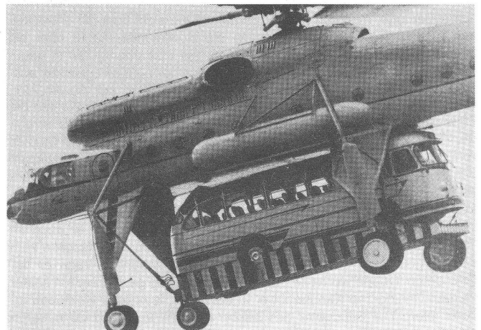
Mi-10 (HARKE), er vermag als «fliegender Kran» Materialtransporte bis zu 14 000 kg durchzuführen.

Für die meisten Helikopter gilt: Reichweite bei grösster Kraftstoffzuladung durchschnittlich 400 km (Mi-6: 650 km) Reichweite bei grösster Nutzlast durchschnittlich 250 km.