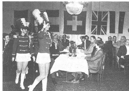
Bildhübsche Majoretten in zackigem Schritt... und im Hintergrund (unter der englischen Flagge) ein etwas skeptisch blickender Zentralpräsident Viktor Cuoni mit seinem nicht minder ernsthaften Gegenüber, dem französischen Viersterne-General Lalande, Präsident FNASOR.