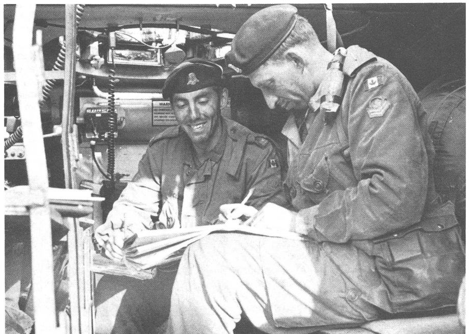
Kanadische Unterführer beim Kartenstudium im gepanzerten Fahrzeug