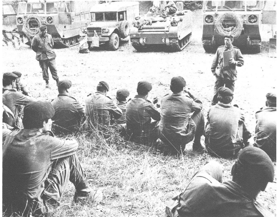
Kanadische Unterführer vor der Front bei der Befehlsausgabe

Neben den allgemeinen Voraussetzungen für eine Verwendung als Unterführer wie gesundheitliche Eignung, gute Führung, entsprechende Leistungen und verfügbare Planstelle muss ein Beförderungsvorschlag durch den Disziplinarvorgesetzten erfolgen. Weiterhin müssen die Anforderungen des «Trade-Level-Systems» (fachliche Qualifikation in einer oder mehreren Verwendungen) erfüllt sein. Hierzu existieren die Leistungsstufen 3 bis 8, deren Erfüllung Voraussetzung für die jeweiligen Beförderungen ist. Es gibt etwa 60 verschiedene Laufbahngruppen, die alle Bereiche der Streitkräfte umfassen. Hat sich ein kanadischer Soldat bei seiner Einstellung für eine bestimmte Richtung entschieden, kann er nach einigen Jahren eine völlig neue Tätigkeit anstreben, wenn er mit der