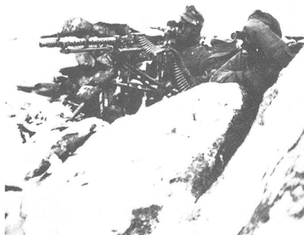
Schweres Maschinengewehr in Feuerstellung

Er wurde durch das Scheinmanöver der rechten Flügelgruppe eröffnet. In schneller Abfahrt überwand der Skizug einen etwa 500 m langen,