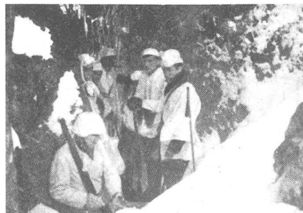
Teile der 7. Kompanie während der Bereitstellung in einer Felspalte

freien Hang und erreichte, noch ehe der erste Schuss beim überraschten Gegner fiel, die dekende Mulde westlich Pkt 650. Dort wurden die Skier abgestreift und durch rasche, wechselnde Bewegungen, Auftauchen und wieder Verschwinden ein Angriff gegen Pkt 643 vorgeführt. Nachdem so der Gegner zum Feuern veranlasst worden war, setzten schlagartig die eigenen schweren Waffen mit zusammengefasstem Feuer auf erkannte Ziele ein. Unter diesem Feuerschutz gingen nun in weitgeöffneter Ordnung die beiden Jägerzüge links vor. Sie wurden zwar durch den tiefen Schnee sehr behindert, strebten jedoch, vom Feind noch wenig beschossen, zügig vorwärts und suchten Anschluss an den Skizug rechts zu gewinnen. Jetzt war der Zeitpunkt gekommen, zu dem der Kletterstosstrupp auf der weithin beherrschenden Höhe 668 einbrechen musste, um von dort aus, schon im Rücken des Gegners sitzend, Unterstützung zu geben. Doch vergeblich wartete die ganze 7. Kompanie darauf. Nun zögerte der Skizug nicht länger und brach, noch den Feuerschutz der eigenen schweren Waffen ausnutzend, über Fels und Schnee auf Pkt 643 ein, dem Gegner in kurzem Kampf mit Handgranaten und blanker Waffe diese vorderste Stellung entreissend. Inzwischen hatten auch die zwei Jägerzüge weiter gut Boden gewonnen, schon befanden sich auch die schweren Waffen im Stellungswechsel nach vorn. Der Angriff ging planmässig voran und schien zu gelingen.