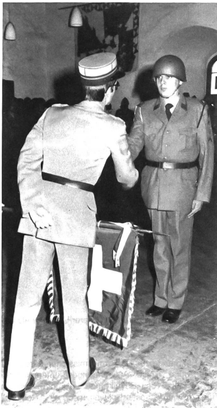
Einheitskommandanten gerecht wird. Die Schule fand mit einem 25-km-Leistungstest, unterbrochen durch praktische Einzelpfahrungen, ihren Abschluss. MKL

Während den fünf Wochen wurde nebst der theoretischen Ausbildung ganz besonders die praktische Arbeit im Verpflegungs- und Küchendienst sowie in der Gefechtsausbildung gefördert, damit der zukünftige Fourier auch unter schwierigen Bedingungen seiner Aufgabe als fachtechnisch versierter Mitarbeiter des