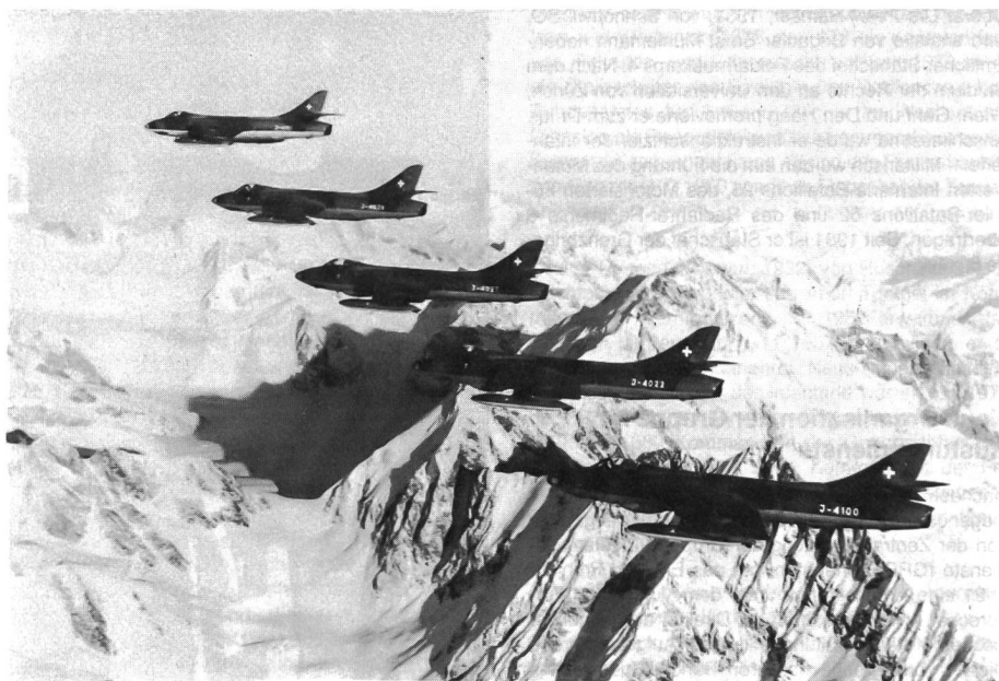
Hunter-Flugzeuge dienen in unserer Luftwaffe als Erdkämpfer und Jagdbomber. Sie kann man öfters im Tiefflug beobachten.

Laut Bundesamt für Militärflugwesen und Fliegerab-