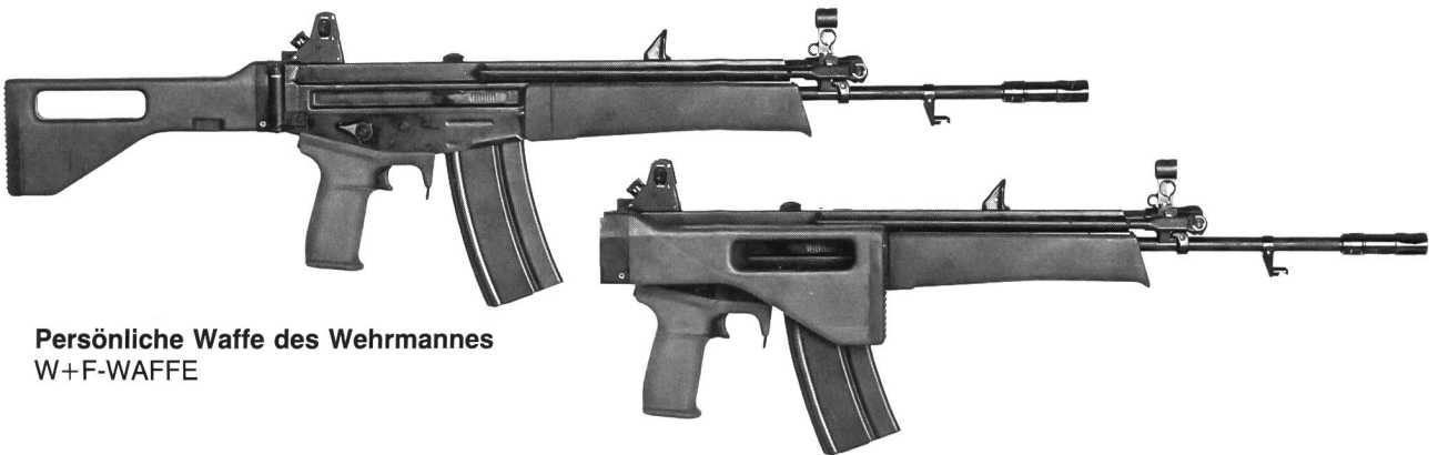
Persönliche Waffe des Wehrmannes W+F-WAFFE