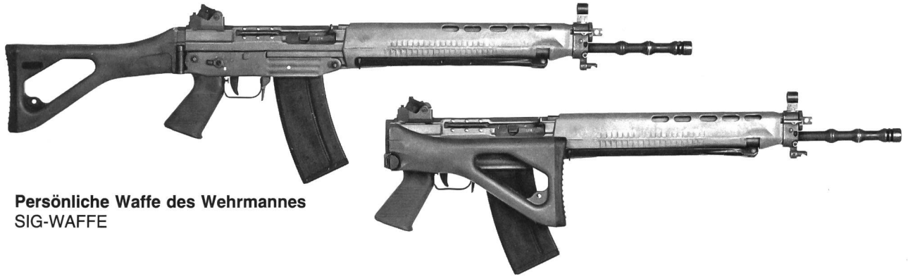
Persönliche Waffe des Wehrmannes SIG-WAFFE