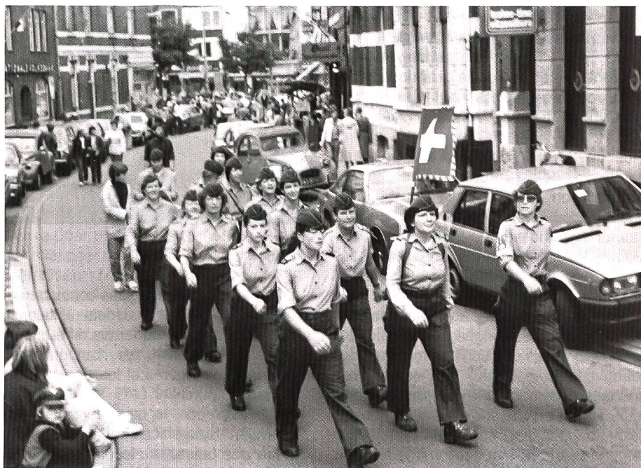
Nur noch einige Meter bis zum Ziel... 2. Marschtag.