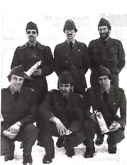
Die besten Einzelwettkämpfer am Gotthardlauf vom 20./21. Februar 1982

Im Rahmen der diesjährigen Ostschweiz Dreikampf-Meisterschaft mit den Disziplinen Gewehrschiessen 300 m, HG-Zielwurf und 6-km-Geländelauf beginnt am 15. Mai in Meilen die Wettkampf-Saison. Die weiteren Austragungsorte sind: 22. Mai 1982 Frauenfeld, 26. Juni Diepoldsau, 3. Juli Amriswil, 7./8. August Neuhausen/Rhf., 21./22. August Lindau ZH, 11./12. September Maischhausen und 18. September Arbon. Die Einzelwettkämpfe sind lizenzfrei, werden in Zivil durchgeführt, und die Startzeiten können jeweils frei gewählt werden. Die Austragung erfolgt in 5 Kategorien, Junioren der Jahrgänge 1963–1967 können wahlweise einen Drei- oder Zweikampf (HG-Werfen und Geländelauf) absolvieren. Zwecks Bezug von detaillierten Ausschreibungen kann das Kontakt-Adressverzeichnis bezogen werden bei: Fritz Stucki, Stauffacherstr 18, 8200 Schaffhausen.