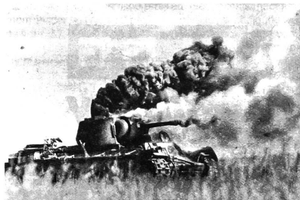
Ein abgeschossener russischer Panzer brennt aus. Bei brennenden Panzern besteht Gefahr, dass sie explodieren (Munition, Treibstoff) und durch herumgeschleuderte Trümmer in der Nähe stationierte Abwehrwaffen gefährden.