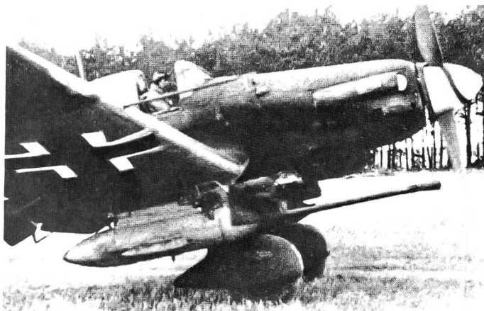
Panzerjagd-Flugzeug. Beachte die Panzerabwehrkanone unter dem Rumpf.