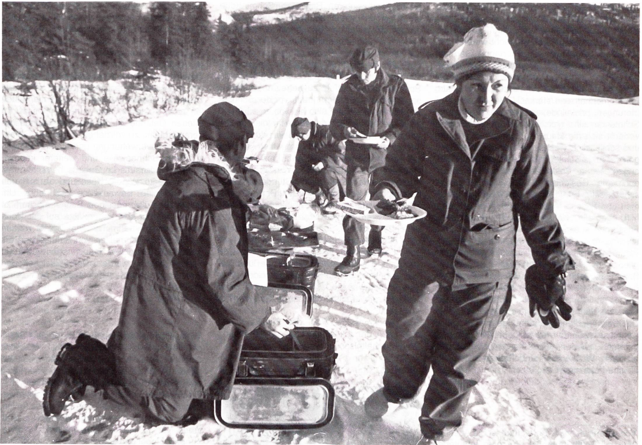
Essensempfang in arktischer Kälte