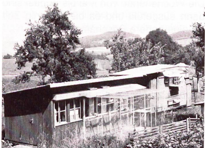
Teillansicht der Schläge in Wiezikon.

Die Wettflüge beginnen in der Schweiz. Für die Region Ostschweiz geht der erste Flug von Schmitten FR aus (146 km), der letzte von Le Mans, Frankreich (661 km). Insgesamt werden rund zwölf Wettflüge pro Saison durchgeführt.