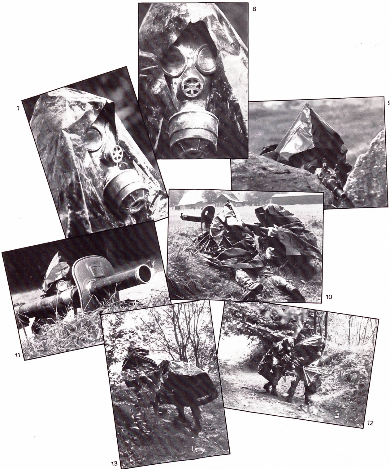
7 + 8 Entgiftet, geschützt und wieder einsatzbereit!