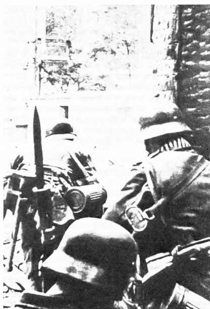
Stosstrupp im Ortskampf, mit blanker Waffe, Mg-Gurte umgehängt.

Das Feindbild hatte ergeben, dass Juvigny von mindestens 1 Bataillon besetzt war. Der Gegner sass nach Beobachtungs- und Aufklärungsmeldungen vor allem