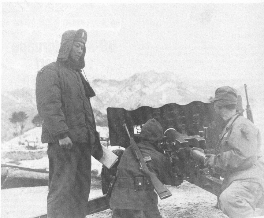
Bedienung einer 57-mm-Panzerabwehrkanone in der Abwehr gegen einen chinesischen Angriff