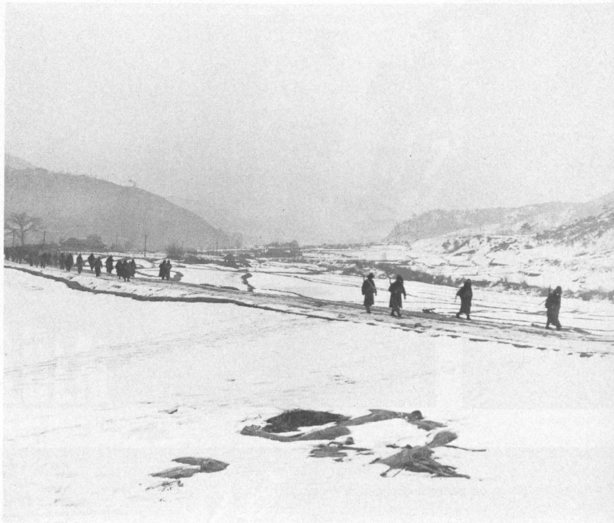
Die Infanterie trug im Koreakrieg die Hauptlast der Kämpfe.

American Military History, Chapter 25 Korea, Department of the Army Fachschrift «Infantry» 1/80, S. 35, Fort Benning, Georgia