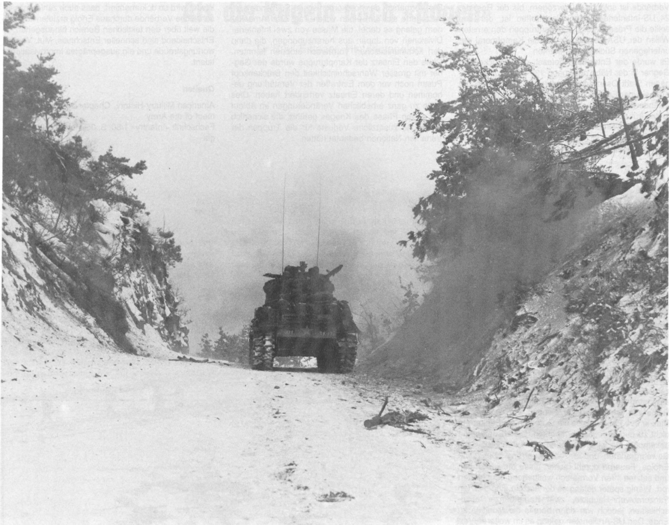
M-4-Panzer im Einsatz bei Sanschangbong-ni im Winter 1951