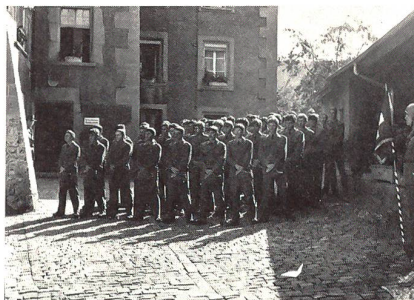
Die Vsg Trp UOS 273/84 anlässlich der Brevetierungsfeier im Hof der Commanderie La Planche, Fribourg