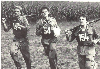
Mit vollem Einsatz dem Ziel entgegen

Die freiwilligen Wettkämpfer der Sommermeisterschaften erfreuen sich in der Felddivision 5 und in der Grenzbrigade 5 vermehrter Beliebtheit: Gegenüber dem Vorjahr steigerte sich die Zahl der startenden Wehrmänner erheblich. Waren es 1983 noch gut 1000 Soldaten, Unteroffiziere und Offiziere, die ihre körperliche Leistungsfähigkeit unter Beweis stellten, so traten in Muri über 1200 Wehrmänner zu den Meisterschaften an.