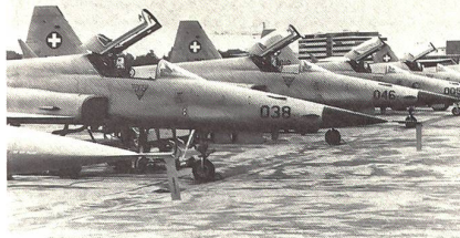
Maschinen des Typs Tiger startbereit auf dem Dübendorfer Flugfeld.