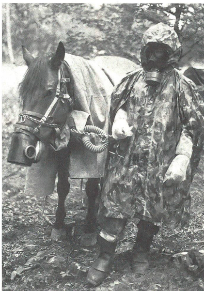
Während der Schutz gegen sekundäre Verstrahlung durch radioaktiven Ausfall für Bürger, Soldat und Militärtier einen hohen Stand erreicht hat, fehlt er für die landwirtschaftlichen Nutztiere, die in ihrer Gesamtheit eine lebenswichtige Lebensmittelressource darstellen, noch weitgehend.

Die Koordinierten Dienste innerhalb dieses Systems sind Poolorganisationen vergleichbar, wo jeder Beteiligte zwecks gemeinsamer Auftragsbefüllung seine personellen und materiellen Mittel für einen konzertierten Einsatz zur Disposition stellt, seiner Verfügungsgewalt jedoch nicht verlustig geht. Die Funktionsweise wird weitgehend von den äusseren Umständen diktiert. Deshalb sind Koordinierte Dienste nicht bis ins Detail durchorganisierbar. Sie arbeiten in rasch wechselnden Lagen mit flexiblen Lösungen, verlangen ein für unsere Mentalität unvorstellbares Mass an Teamgeist und Improvisationsvermögen.