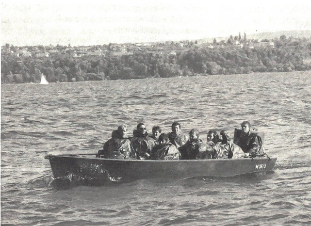
Genie-Offiziersschüler auf «fremden Gewässern», genauer gesagt auf dem Bielersee.