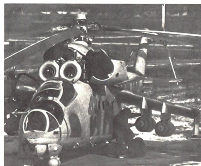
Waffenkontrolle am sowjetischen Kampfhelikopter vom Typ Mil Mi-24 «Hind C».

Während militärisches Fluggerät aus dem Westen fast immer für einige tausend Flugstunden konstruiert wird, haben die Sowjets hier bewusst die Einsatzdauer dieses Mehrzweckhubschraubers nur auf einige hundert Flugstunden begrenzt, was im Kriege etwa der mittleren Lebenserwartung eines Transporthelikopters entspricht.