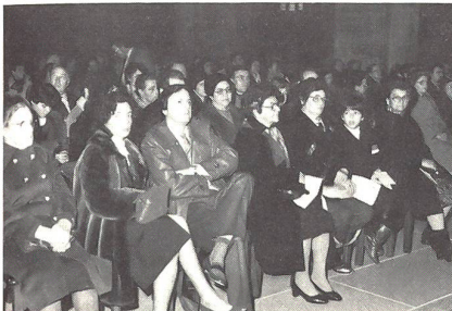
Die stolzen Angehörigen der jungen Chefs.

zu ausländischen Armeen – aber sie hat Erfolg. Doch dieser Erfolg stellt sich nur ein, wenn Sie und alle Kader bestrebt sind, als Chefs immer vorbereitet anzutreten und alle Führungsprobleme ernsthaft zu lösen. Ich wünsche Ihnen den Mut zu fordern und das Verständnis für die Ihnen anvertrauten Rekruten.