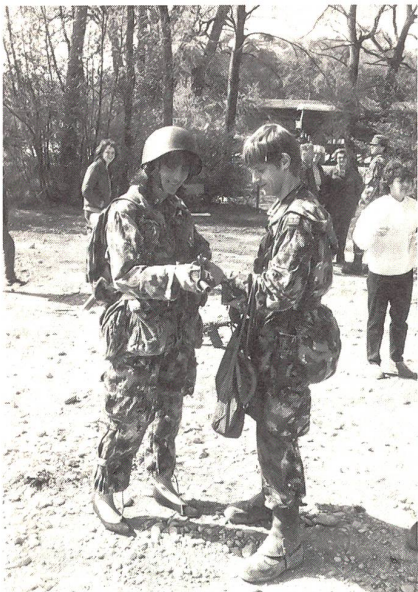
Er hat seinen Schatz in den «Kämpfer» gesteckt und bringt ihm grad noch die soldatisch richtige Handhabung des Sturmgewehres bei.