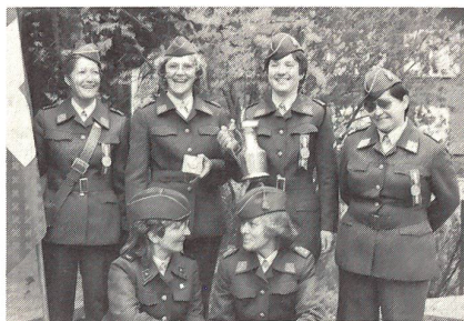
Die strahlende Marschgruppe mit der endgültig in den Besitz des FHD-Verbandes Basel-Stadt übergebenen Zinnkanne.