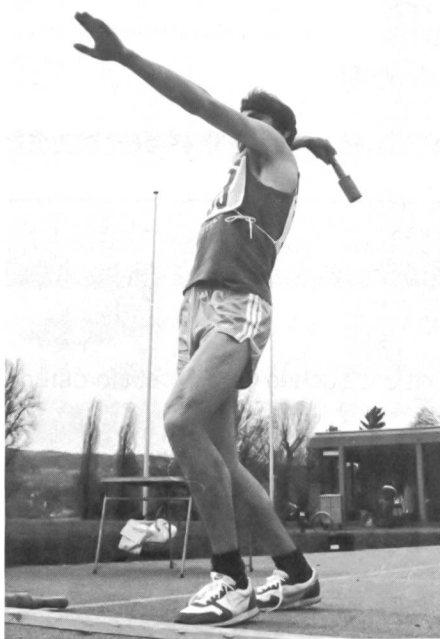
Beim Frühjahrs-Dreikampf in Steckborn musste mit dem Wurfkörper ein kleines Ziel in 20 Meter Entfernung getroffen werden.

Der UOV Bischofszell plant ein eigenes Klublokal mit Materialmagazin. Eine Holzbaracke, die kostenlos übernommen werden kann, soll in Fronarbeit aufgebaut werden und 24 Personen Platz bieten.