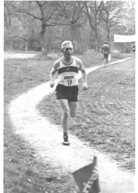
Zum Militärischen Dreikampf in Langenthal gehörte auch ein 6,5-km-Geländelauf.