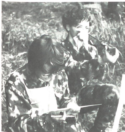
Eine Patrouille in Liestal an der Arbeit.

Von den am 13./14. Juni in Liestal durchgeführten Sommer-Wettkämpfen der A Uem Trp / FWK / Trsp Trp / FF Trp liegen in der Kategorie MFD die folgenden Resultate vor: