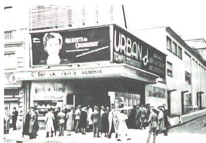
«Gilberte de Courgenay» lief 1941 bei der Uraufführung im Zürcher Kino Urban zwölf Wochen.