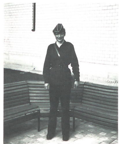
Im September 1984 absolvierte Motf MFD Kocher den Einführungskurs für FHD in Winterthur.