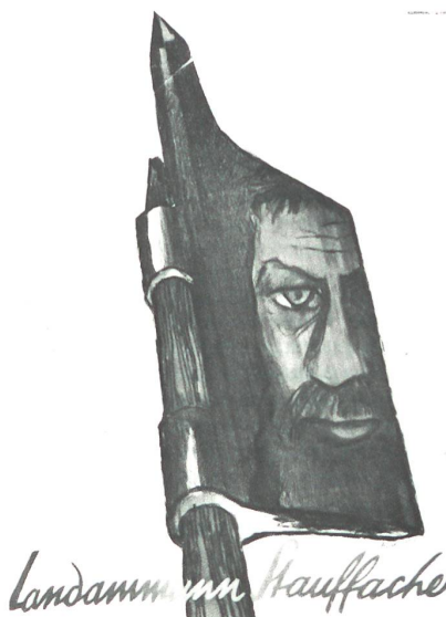
Plakat von Alois Carigiet 1941.