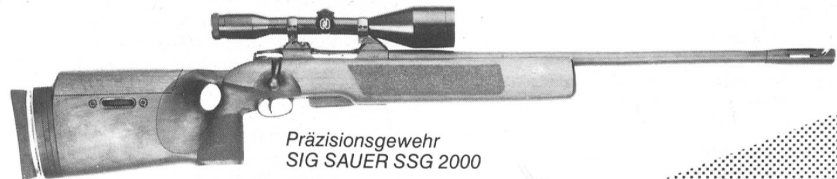
Präzisionsgewehr SIG SAUER SSG 2000

SIG Schweizerische Industrie-Gesellschaft Geschäftsbereich Waffen CH-8212 Neuhausen am Rheinfall/Schweiz Tel. 053/8 61 11 Telex 896 021 sig ch