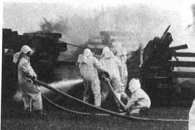
Eindrucksvolle Demonstration der Luftschutztruppen.

Die mit Küchenchefs beider Basel sorgten für das leibliche Wohl der Besucher, und die eingesetzte Feldbäckerei meldete einen Rekordumsatz von 1040 Kilogramm «Ordonnanz-Brot».