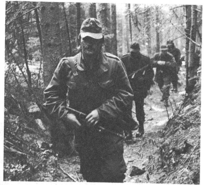
Jagdkämpfer des österreichischen Bundesheeres beim Marsch durch einen Gebirgswald ins Einsatzgebiet.

Eine der grössten Übungen in der 30jährigen Geschichte des österreichischen Bundesheeres wurde vom 6. bis 17. Oktober 1986 in der Steiermark durchgeführt. Rund 23 000 Soldaten – über den gesamten Übungszeitraum verteilt waren es sogar über 30 000 –, etwa 5000 Räderfahrzeuge, etwa 300 gepanzerte Fahrzeuge sowie Jagdbomber, Flächenflugzeuge und Hubschrauber nahmen daran teil und übten Verteidigung, Jagdkampf, Fliegerabwehr und Mobilmachung. Soldaten aus allen Bundesländern – in der Masse Milizsoldaten – waren in der Ober- und Oststeiermark eingesetzt, auch die angrenzenden Bezirke der Bundesländer Salzburg, Kärnten und Burgenland waren