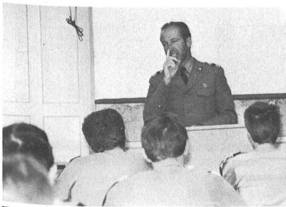
Theorie durch Kdt ZIS.

2. Welche Ausbildung müssen Sie absolvieren? Grundsätzlich lässt sich die Ausbildung zum Instruktionsunteroffizier in zwei Blöcke gliedern, nämlich: 1. eine Grundausbildung an der Zentralen Schule für Instruktionsunteroffiziere (ZIS) 2. eine waffengattungsspezifische Ausbildung durch die betreffenden Bundesämter bzw Dienstzweige. Diese Ausbildung ist je nach Waffengattung in Umfang und Dauer sehr verschieden. Der vorliegende Artikel beschränkt sich deshalb auf die Zentrale Schule für Instruktionsunteroffiziere.