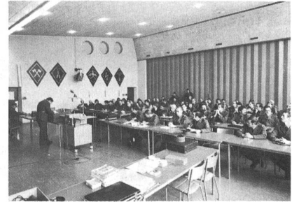
Presse- und Werbeseminar des SUOV im Filmsaal «Ländi» des Waffenplatzes Brugg.

Etwa 60 Sektionsvertreter trafen sich Ende November im Filmsaal «Ländi» des Waffenplatzes Brugg zu einem Presse- und Werbeseminar des SUOV. Die beiden Schwerpunkte der Veranstaltung bestanden darin, Anregungen für die Durchführung von Werbeveranstaltungen in militärischen Schulen zu geben und zu zeigen, welche Regeln bei der Zusammenarbeit mit der lokalen und regionalen Presse eingehalten werden sollen.