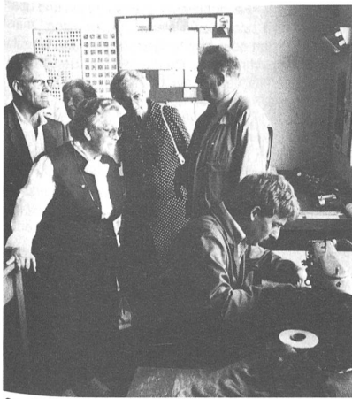
Gern benutzte man die Gelegenheit, nochmals einen Blick in die alten Werkstätten zu werfen. Im Bild der Besuch der Schneiderei.

Brugg ist aber auch MWD-Zentrum und als solches verantwortlich für ungefähr 800 Motorfahrzeuge und 350 Anhänger. Eine weitere der sieben verschiedenen Abteilungen der Brugger Zeughausverwaltung nennt sich schlicht «Genie und Luftschutz». Sie ist verantwortlich für Baumaschinen, Spezialanhänger, Brückenmaterial und für eine grosse Zahl von Aggregaten, diverse Kranwagen und anderes mehr.