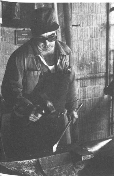
Bald wird auch der Zeughaus-Schmied einen moderneren Arbeitsplatz haben.

Beim Gang durch die Allgemeinen Zeughauswerkstätten – sie umfassen die Waffen-, die Fahrrad- und die Übermittlungswerkstatt sowie die Schneiderei, die Sattlerei, die Abteilung Persönliche Ausrüstung, die Schlauchbootwerkstatt, die Schreinerei, die Bootsreparaturwerkstätte und das Sanitätsmaterial. Man hörte von verschiedenen Besuchern spontan die (berechtigte!) Äusserung: «Tatsächlich, es ist höchste Zeit, dass Brugg ein neues Zeughaus bekommt!» Da wird teils noch unter Umständen gearbeitet wie zur Handkarrenzeit. Besser ist es lediglich in einigen mehr oder weniger direkt der Kaserne «vorgelagerten» Abteilungen, die auch nach der Inbetriebnahme des neuen Zeughauses an ihrem jetzigen Standort bleiben.