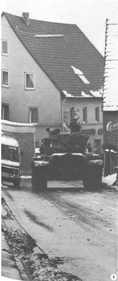
1 Panzerkolonne durchfährt Ortschaft in der Bundesrepublik.