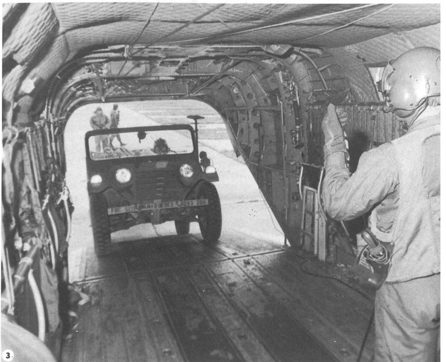
3 Fahrzeuge werden in Transportflugzeuge verladen.