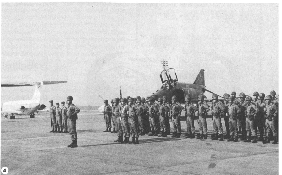
4 US-Soldaten nach Eintreffen per Flugzeug in Europa

setzte, wirken die Transportwege in Europa von der Nordsee bis Bayern eher bescheiden.