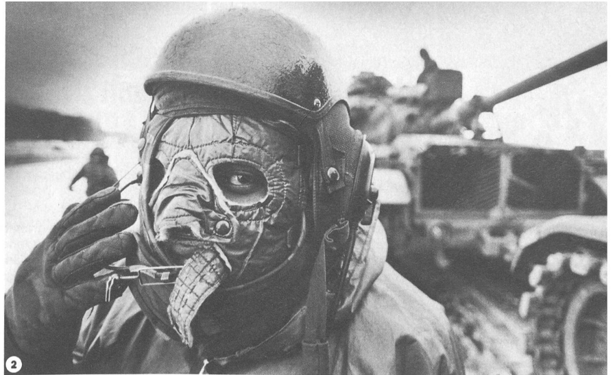
2 Kälteschutzmasken waren wegen der milden Witterung nur selten nötig.