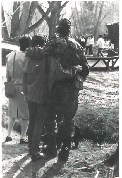
Sehnsucht: «Gäll, du bliibsch mer treu...!»