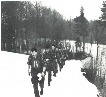
Patrouille Nr 14 beim km 22

105 Aspiranten starteten am 4. März 1986 bei gutem Wetter zur letzten grossen Bewährungsprobe ihrer OS. Am Ziel in Innerberg trafen dann schliesslich noch genau 100 Aspiranten ein, 5 mussten vom Schularzt aus dem Lauf genommen werden. Nach den Worten von Maj i Gst von Erlach (Kp Kdt der OS), leisteten die Aspiranten gute Arbeit, besonders wenn man bedenkt, dass sie in den vorhergehenden Tagen die Durchhalteübung bei zum Teil sehr misslichen Bedingungen absolvierten (Nebel, Temperaturen bis zu -18 Grad, kaum Schlaf usw). Cac