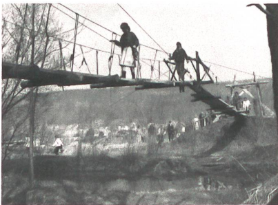
Mit perfekter Schnürleinenarbeit: Holzsteg über den Sumpf.