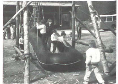
Schlauchbootschaukel: ein Hit für kleine Besucher.

sehen: Eindrücklich waren vor allem die Holzstegbauten, bei denen perfekte Schnürleinenarbeit nötig ist. Applaus gab es unter anderem auch für den Einbau des nachgerade legendären Stegs 58 und die ebenfalls bewährte Feste Brücke 69 über das Strängli sowie die 3-Tonnen-(Karren-)Fähre und natürlich für