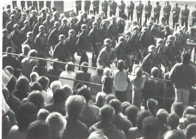
Achtung rechts: Vorbeimarsch bei der Schachentribüne.

Weit über 3000 Besucher liessen sich am traditionellen Tag der offenen Türen auf dem Waffenplatz Brugg am 26. April über den Ausbildungsstand der Frühjahrs-Genie-Rekrutenschule 1986 informieren, deren