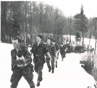
Patrouille Nr 28 beim km 22