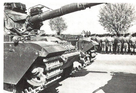
Pz Bat 16 verabschiedet den legendären «Centi».