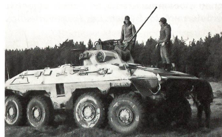
Der 20 Tonnen schwere Spähpanzer «Luchs». Das mit einer 20-mm-Maschinen-Kan und einem Flab Mg bewaffnete Pz Fz fährt auf der Strasse max 90 km/h und im Wasser 10 km/h. Der Redaktor durfte selber am Steuer sich von der einfachen Manövrierbarkeit und Geländegängigkeit überzeugen.