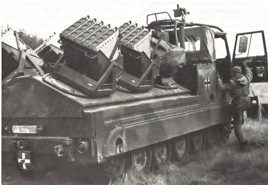
Das vorgeführte Minenwurfsystem (Mi WS) «Skorpion» auf dem Fahrgestell M 548 G-A1. In den Pionierkompanien der Brigaden sind 4 bzw 6 solcher Werfer. Die volle Kampfbeladung des Mi WS umfasst 600 Pzaw WMI, mit denen innerhalb von 10 bis 15 Min ein 1500 m breite Sperre gelegt werden kann.