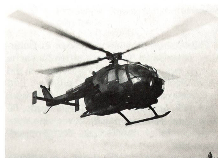
«Star» der Vorführungen war der Panzerabwehrhelikopter BO 105 (PAH1). Er kann total 8 Hot Pzaw Raketen mitführen und bis max 3,8 km weit schießen. Diese Pzaw Waffen werden im Schwarm von 7 Helikoptern eingesetzt.