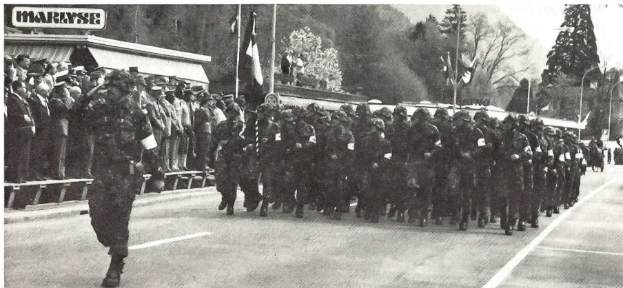
Vorbeimarsch einer Sanitätsrekreutenschule.

Verkehrsbüro, 1337 Vallorbe, Tel. 021 843 25 83