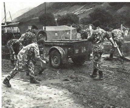
Nicht nur Maschinen halfen Schäden beheben, auch mit Schaufel und Pickel wie hier in Realp halfen Wehrmänner mit. Dank der entsprechenden beruflichen Ausbildung konnten Wehrmänner auch mit zivilen Baumaschinen Hand anlegen.