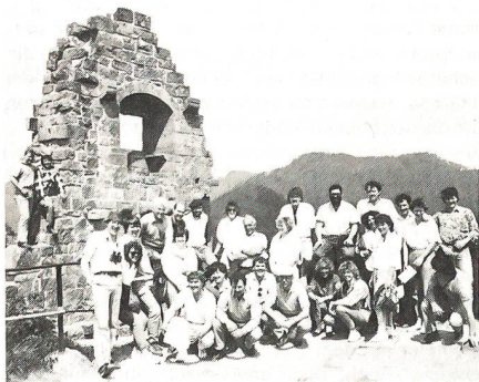
chiedene Kriegsschauplätze, unter anderem die Maginotlinie und der Hartmannsweilerkopf, besucht wurden. HEE

Über die Auffahrtstage wurde ein dreitägiger Vereinsausflug ins Elsass unternommen, wobei ver-