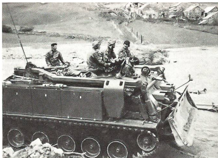
Der Entpannungspanzer der Pz Hb D Btr 10 leistete wertvolle Unterstützung in Realp; so konnte durch Errichten von Erdwällen das Dorf vor einer weiteren Überflutung durch die Furkareuss verschont werden. Die Wehrmänner, einmal durch eine andere Aufgabe herausgefordert, waren besonders motiviert.

in Mitleidenschaft gezogenen Gebiete des Reusstales im Urnerland, das Puschlav und das Goms getroffen. Auch andere Regionen, die in der Berichterstattung etwas zu kurz kamen, sind nicht minder heftig von den Unwettern verwüstet worden. Zu ihnen zählt unter anderem auch das Urserental. WK-Truppen leisteten dort während Tagen Spontanhilfe; sei es mit Pickel und Schaufel, mit einem Entpannungspanzer, Kranwagen und/oder Übermittlungsmitteln. Die Bilder mögen einen Eindruck von diesen Tagen und diesen Einsätzen vermitteln, die bei Bevölkerung und Truppe in nachhaltiger Erinnerung bleiben. Die Tatsache, dass beispielsweise Realp während Tagen von der Aussenwelt abgeschnitten war und die dort im WK weilende Pz Hb D Btr 10 wertvolle Unterstützung leistete, hat zu einem überdurchschnittlich guten Einvernehmen zwischen ziviler Bevölkerung und Militär geführt. JKL