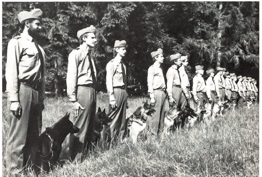
Parade der Paare zur Siegerehrung.

Auf Patrouillengängen, in der Nacht oder bei schlechter Sicht als auch in unwegsamem Gelände, vermag der Hund seinem Führer frühzeitig Unregelmässigkeiten anzuzeigen. Das Überraschungsmoment kann weitgehend ausgeschaltet oder auf ein Minimum reduziert werden. Der Einsatz des Katastrophenhundes bezweckt die Ortung von Verschütteten, so wie der Lawinenhund dies im Schnee tut. Heute stehen von den 10000 Sportkynologen 440 Hunde in der Schweizer Armee mit den entsprechenden Aufgaben im Einsatz. Also auch im Zeitalter des Computers und der elektronischen Kriegführung hat das Tier «Hund» in der Schweizer Armee einen wichtigen Auftrag zu erfüllen.