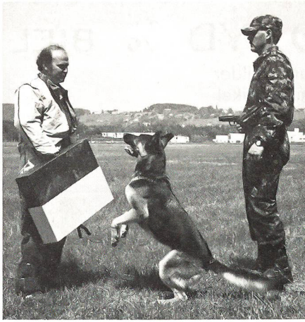
Respektvoll stellt dieser Deutsche Schäfer diesen Saboteur.