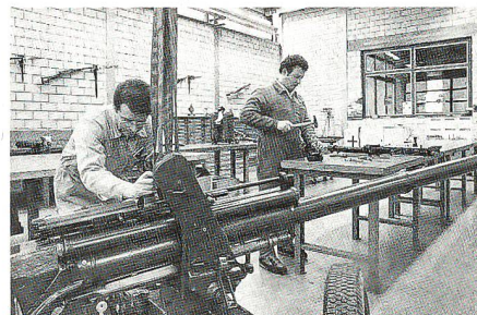
Arbeit in den neuen, modern eingerichteten Betriebsbauten von Mels

ner Weise mehr genügten, belegt der umfangreiche Bedürfnisnachweis. Zusammen mit verschiedenen Bundesämtern wurde in langjähriger, gründlicher Planungsarbeit ein Projekt realisiert, das vielfältigen Begehren Rechnung trägt. Im Verbund mit der Tankanlage und den Neubauten des Waffenplatzes sind die sanierten Einrichtungen auch als Dienstleistungsbetrieb für die Truppe aufgewertet worden. Sie wird von den verbesserten Rahmenbedingungen profitieren.