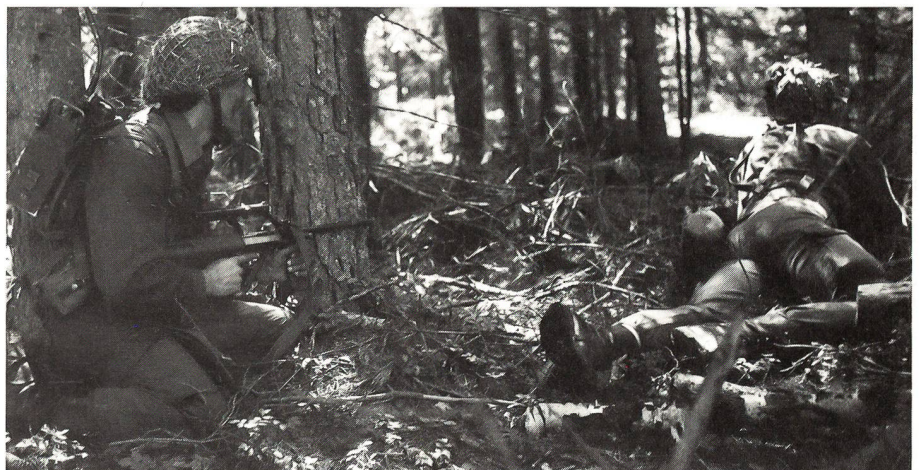
Jagdkampf mit Störaktionen ....

Übungsthemen waren der Kampf in einer Raumsicherungszone, die Verteidigung eines Schlüsselraumes und der Einsatz von Jagdkampfkraften. Dabei war der feindlichen Subversion Rechnung zu tragen und durch intensive Aufklärung ein aktuelles Lagebild in der Einsatzzone herzustellen. Die ost-westlich verlaufenden Bewegungslinien mussten nachhaltig unterbrochen und der Angreifer durch bewegliche Kampfführung abgenutzt werden. Schon an der Grenze der Raumsicherungszone war der Feindvorstoss durch intensiven Jagdkampf zu behindern und abzunutzen. In den Schlüsselräumen hatte nachhaltig verteidigt zu werden. Führungs-, Versorgungs- und Unterstützungstruppen des Aggressors waren nach dem Auftreffen der Angriffsspitzen auf die Schlüsselräume zu behindern und zu schwächen. Auch nach dem Durchstossen des Feindes durch die Einsatzzone musste der Jagdkampf fortgesetzt und vor allem gegen Führungseinrichtungen, Unterstützungswaffen und feindliche Sicherungen geführt werden.