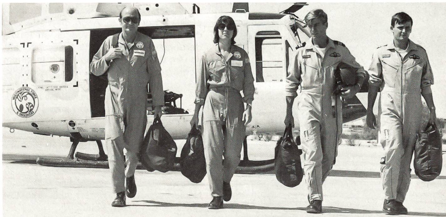
Eine zivile Beobachterequipe der MFO vor ihrem Einsatz.

Die Erläuterungen McCarters zur Informationspolitik tönen fast entschuldigend: «Wir bewegen uns auf sehr dünnem Eis zwischen zwei Parteien. Unser Auftrag ist militärisch klar umschrieben; an den halten wir uns. Fragen politischer und diplomatischer Natur werden vom Römer Hauptquartier der MFO und den Büros in Tel Aviv und Kairo direkt mit den betreffenden Regierungen besprochen.» Die Abneigung vor Schlagzeilen geht so weit, dass vom kürzlichen Treffen der Verbindungsoffiziere Ägyptens und Israels in El Gorah nichts in die Presse gelangte. Fotos wurden nur für das MFO-interne Archiv geknipst. Die jährlichen Kosten der MFO von 90 Mio Dollar teilen sich die USA, Ägypten und Israel. Sorgen in El Gorah über drohende Budgetkürzungen dürfte Japan mit seinem Beschluss, ab 1988 2 Mio pro Jahr beizusteuern, einigermaßen aufgefangen haben. Sowohl Kairo als auch Jerusalem sehen in den multinationalen Truppen im Sinai ein friedenserhaltendes Element. Das geht schon daraus hervor, dass das Mandat anfänglich jedes Jahr erneuert wurde, heute aber bis auf Zusehen hin gilt.