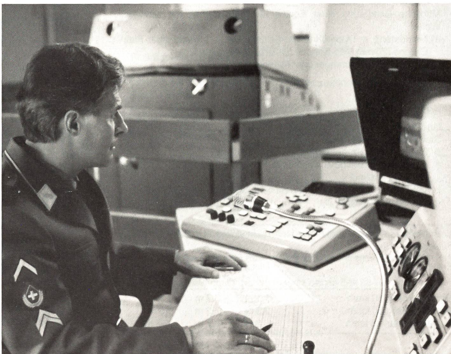
Ausbildung des Fahrers im Fahrsimulator FASIP (Kommandopult im Vordergrund, Kabine im Hintergrund)