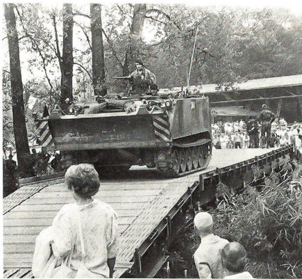
Kurze Zeit nach dem Einbau der Brücke 69 fährt der Geniepanzer 63 über das Wasserhindernis.

Toller Einsatz und gute Laune waren am «Tag der offenen Türen» auf dem Waffenplatz Brugg Trumpf. Jede Kompanie bemühte sich, in der Präsentation ihrer Spezialitäten die andere zu übertrumpfen. Und die Rekruten hatten offensichtlich den Pausch daran. So empfingen die einen zum Beispiel ihre Herzdamen und ihre Mütter – «als Dank für die moralische Unterstützung, die wir von euch jeweils während des Urlaubs erhalten» – mit einer Rose. Bei allen Arbeitsplätzen gab es «Freundschaftsbeizli» mit Gratis-Speis- und -Trank, und was dem Berichtersteller besonders positiv auffiel: Seit Jahren wurde am Besuchstag der Brugger Genie-RS nicht mehr so viel und so eindrückliche Genie-Handarbeit «alter Prägung» gezeigt wie diesmal. Angefangen beim Bau (und Betrieb) einer 3-Tonnen-Karrenfähre, eines