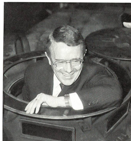
Der Chef EMD liess es sich nicht nehmen, für einmal den Platz des Panzerkommandanten einzunehmen.