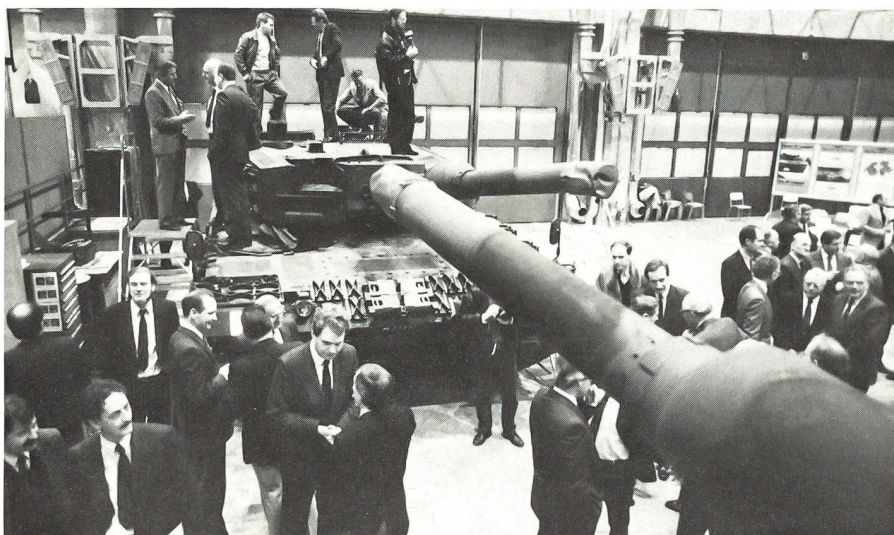
Gerne wird von der Möglichkeit Gebrauch gemacht, die Panzer im Detail zu besichtigen.