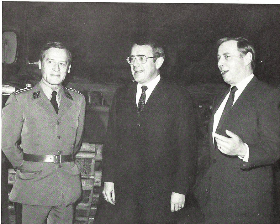
Drei glückliche Gesichter vor dem ersten Pz 87, Leo, aus Schweizer Produktion. (Kkdt Lüthy, Bundesrat Koller, Rüstungschef Wittlin).

Im anschliessend vorgeführten Film erhielten die Anwesenden einen Einblick in den Schweizer Lizenzbau des Pz 87, Leo. In eindrücklichen Bildern wurde der Beitrag der zwölf Konsortiumsmitglieder, welche unter dem Generalunternehmer Contraves zusammengefasst sind, vorgestellt. Zu den Klängen des Spiels der Eidgenössischen Konstruktionswerkstätte, unter der Leitung von Edith Sahli, konnten alsdann die zwei Panzer sowie die Integrationshalle – wo der Zusammenbau des ganzen Panzers erfolgt – besichtigt werden. So liess es sich auch Bundesrat Koller nicht nehmen, für einmal den Platz des Wagenkommandanten einzunehmen.