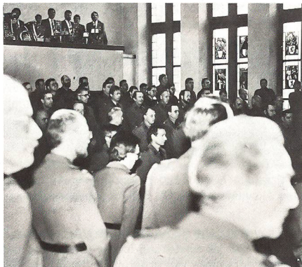
180 Offiziere des MED versammelten sich im Grossratssaal des Rathauses Bern

Sicherheitspolitik und Konfliktanalyse an der ETH Zürich, auf die gegenwärtigen Bemühungen der beiden Supermächte USA und Sowjetunion zum Abschluss des IMF-Abkommens ein. Ausgehend von den geschichtlichen Fakten, dass das Sicherheitsverständnis der Sowjetunion bisher auf der Ausdehnung ihrer Macht beruht habe, schätzte er eine drastische Abkehr von diesem Kurs unter dem Regime von Gorbatschow als eher unwahrscheinlich ein, da die beharrenden Kräfte in der Sowjetunion gross seien. Ein Kompromiss dürfte als realistischer angenommen werden. Auf der andern Seite stehe nach dem Streichen der Mittelstreckenraketen Europa geschwächt da, weil auf konventionellem Gebiet ein Ungleichgewicht der Kräfte zwischen NATO und WAPA vorhanden sei. Für die Schweiz zeige sich deshalb auch nach dem Abschluss eines IMF-Abkommens keine Morgenröte, das auf der reinen Disuasione beruhende Sicherheitskonzept kurzfristig zu ändern. Wohl könne jedoch unser Land den Beitrag zu einer Friedenspolitik in Europa noch verstärken.