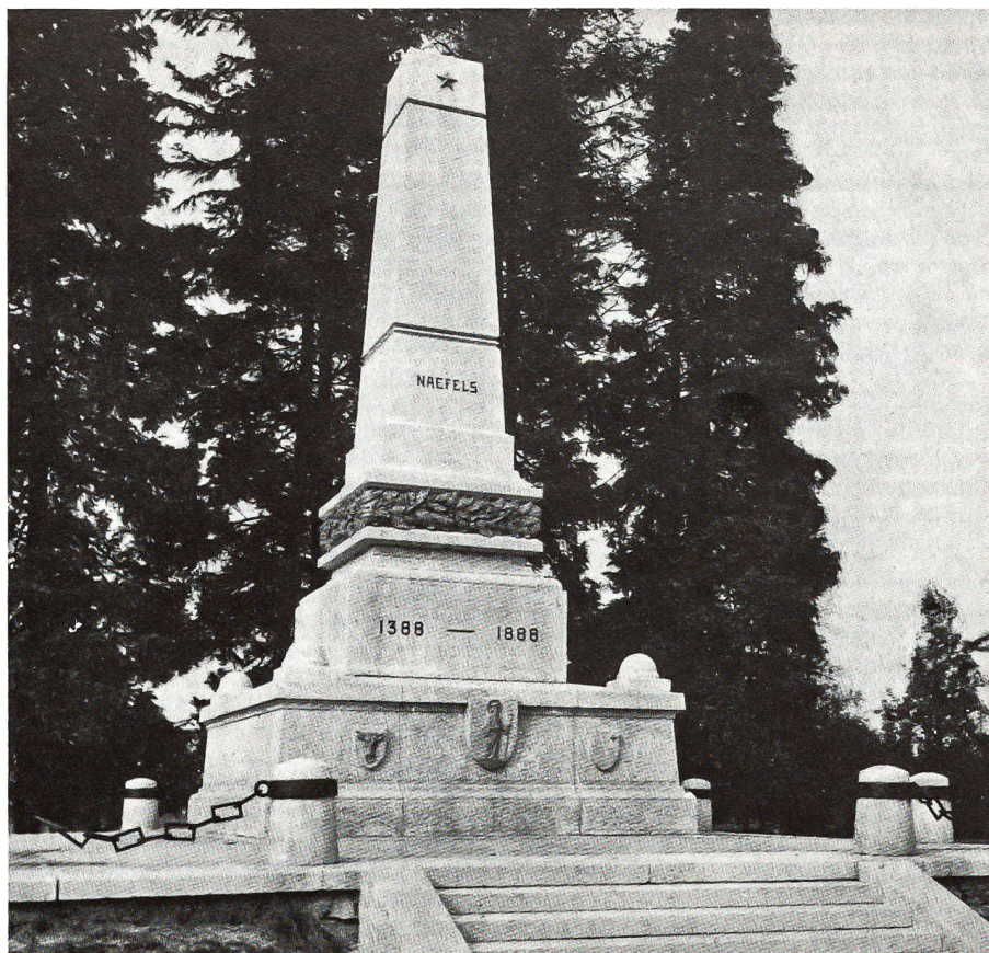
Schlachtdenkmal zu Näfels. 1888 errichtet, anlässlich der 500-Jahr-Feier der Schlacht bei Näfels.