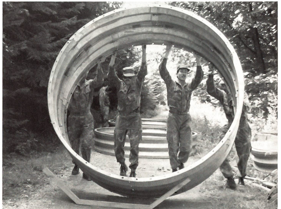
Die Elemente aus Stahl werden bereitgestellt.

Russland und in Osteuropa; sodann im Westen nach dem Ausbruch der 3. amerikanischen Armee aus der Halbinsel Cotentin. Aber auch auf diesen durch schnell ablaufende Operationen gekennzeichneten Kriegsschauplätzen gab es immer Phasen der Erstarrung, mussten weite Räume statisch gehalten oder gesichert werden, grub sich die Infanterie also wieder ein. Im gebirgigen Gelände Italiens südlich von Rom erzielten die Deutschen Kesselrings mit einer das Gelände gekannt ausnutzenden elastischen Verteidigung während längerer Zeit eindrucksvolle Defensiverfolge.