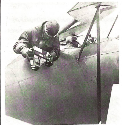
Jubiläumsausstellung 150 Jahre Landestopographie im Verkehrshaus der Schweiz

Seit 1930 verwendet die Landestopographie Luftbilder für die Erstellung und Nachführung der Karten. Unser Bild zeigt, wie aus einem offenen Vermessungsflugzeug Geländeaufnahmen geschossen wurden.