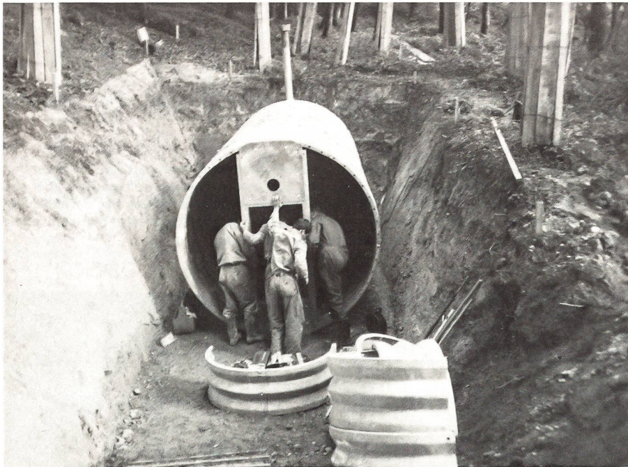
Die einfachen Montagearbeiten. Mit einem Bulldozer oder einem ähnlichen Gerät kann der Shelter in kürzester Zeit mit der ausgehobenen Erde wieder zugedeckt werden.

nur ab Fahrzeug und hält sich nicht nur in Fahrzeugen auf. Auch bei den hochmobilen Formationen der NATO zum Beispiel in Deutschland wird der relativ klassische Infanteriekampf aus Stellungen heraus vorbereitet. Das entspricht auch gesunder militärischer Logik angesichts der defensiven Aufgabenstellung der NATO, der Absicht, eine «Vorneverteidigung» zu führen, d.h. den Kampf gegen einen Aggressor von der Grenze an aufzunehmen sowie angesichts des Geländes in weiten Teilen der Bundesrepublik Deutschland und allgemein Europas, das in wichtigen Abschnitten heute erst noch stark überbaut ist.