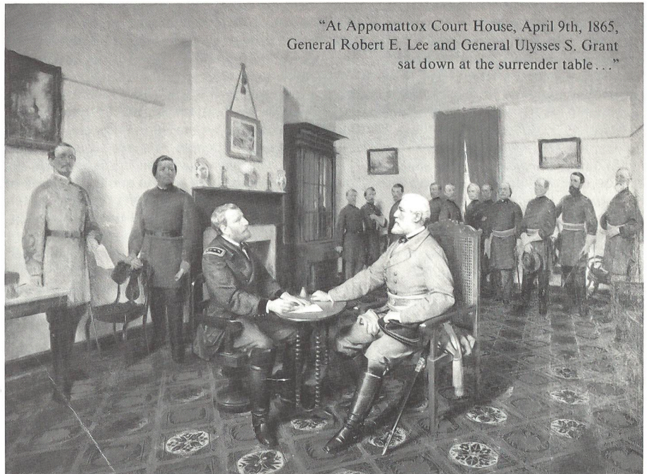
“At Appomattox Court House, April 9th, 1865, General Robert E. Lee and General Ulysses S. Grant sat down at the surrender table . . .”