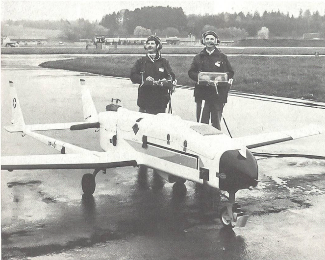
Die neue Drohne, 4,7 Meter lang, einen Meter hoch und 5,7 Meter breit, vorläufig noch von zwei Männern über ein Pult beim Start und bei der Landung ferngelenkt. In Zukunft sollen auch diese Aufgaben von der Elektronik übernommen werden.