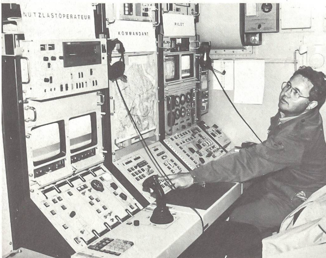
In der Kontrollstation: Vom mobilen Einsatzwagen aus wird das Kleinflugzeug über diese Apparatur in der Luft ferngelenkt. Hier treffen auch die TV-Bilder ein.