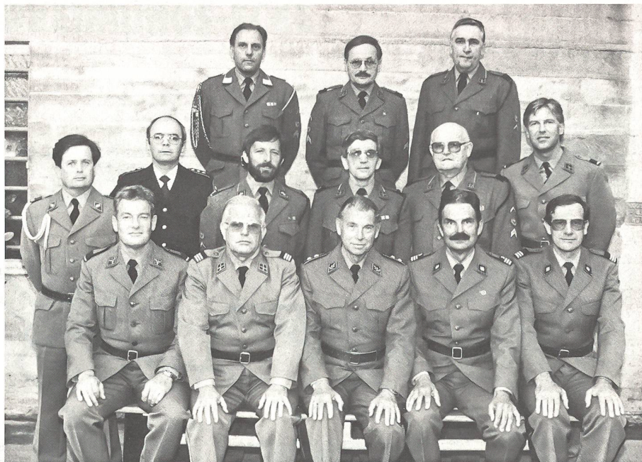
Das Organisationskomitee der SUT 90 setzt sich folgendermassen zusammen: