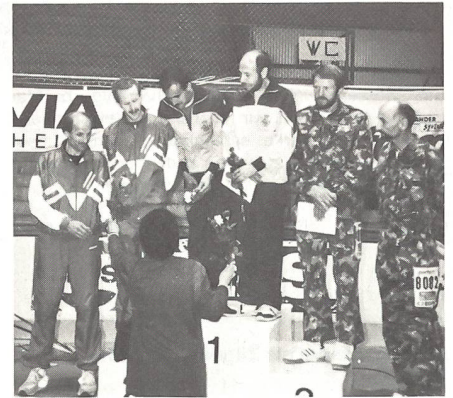
1. Esc cent de education fisica, 2. LG UOV Bern-Burgdorf, 3. Läufergruppe Lyss

Wie schon in den letzten Jahren, wurden wiederum die Organisation und die Betreuung auf der Strecke von den Teilnehmern einhellig gelobt. Die Angehörigen der ausländischen Streitkräfte wollen auch im nächsten Jahr nach Möglichkeit wiederum am Bieler Hunderter teilnehmen, wer weiss, vielleicht gelingt den beiden Läufern aus Spanien ja ein Hattrick? Das Engagement, mit dem sich die ausländischen Delegationen und die Spezialisten aus der Schweiz an die Arbeit machen, zeigt, dass auch in der heutigen Zeit eine derartige Veranstaltung ihre Liebhaber findet.