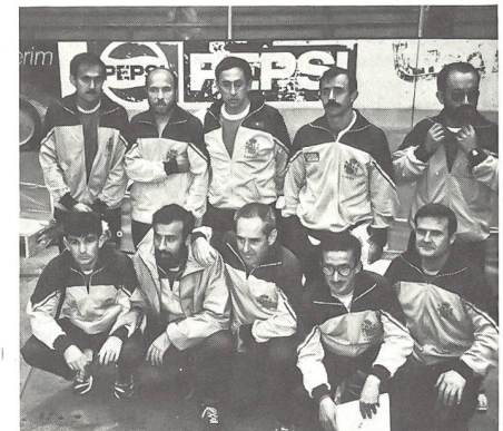
Geschafft: Die gesamte spanische Delegation der Escuela central de education fisica stellt sich den Fotografen (links oben die beiden Sieger)