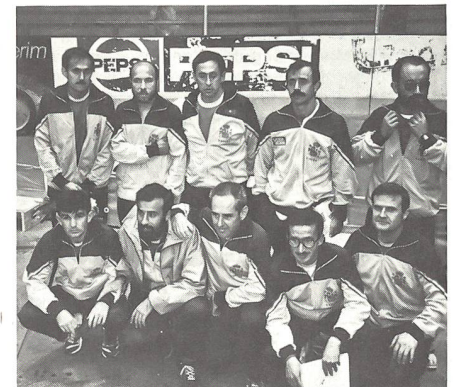
Geschafft: Die gesamte spanische Delegation der Escuela central de education fisica stellt sich den Fotografen (links oben die beiden Sieger)