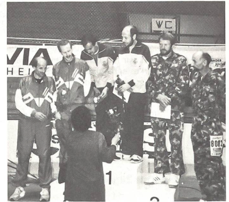
1. Esc cent de education fisica, 2. LG UOV Bern-Burgdorf, 3. Läufergruppe Lyss

Wie schon in den letzten Jahren, wurden wiederum die Organisation und die Betreuung auf der Strecke von den Teilnehmern einhellig gelobt. Die Angehörigen der ausländischen Streitkräfte wollen auch im nächsten Jahr nach Möglichkeit wiederum am Bieler Hunderter teilnehmen, wer weiss, vielleicht gelingt den beiden Läufern aus Spanien ja ein Hattrick? Das Engagement, mit dem sich die ausländischen Delegationen und die Spezialisten aus der Schweiz an die Arbeit machen, zeigt, dass auch in der heutigen Zeit eine derartige Veranstaltung ihre Liebhaber findet.