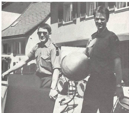
Die jungen Offiziere als Zügelmäänner im Altersheim Zurzach.

Mit ihrem zuvorkommenden Verhalten fanden die feldgrauen Zügelmäänner problemlos das Gespräch mit den Betagten, auf deren Wünsche, was im neuen Zimmer wo hingestellt oder (wenn es sich um Bilder handelte) aufgehängt werden sollte, wenn immer möglich eingegangen wurde. Fast wie Profis nahmen die jungen Offiziere Schränke und Betten auseinander, trugen sie über die Strasse ins neue Altersheim und setzten sie dort wieder zusammen, wobei sich auch das vielseitig verwendbare Militärsackmesser bestens bewährte. In weiteren Arbeitsgängen wurden Tische, Stühle, Lampen, Bilder, Kleider, Blumenstöcke und alle weiteren persönlichen Sachen der Pensionäre vom alten ins neue Altersheim gezügelt. Die ganze Zügelaktion lief dermassen gut, dass die Betagten ihr Mittagsschläfchen bereits in ihrem neuen Daheim machen konnten.